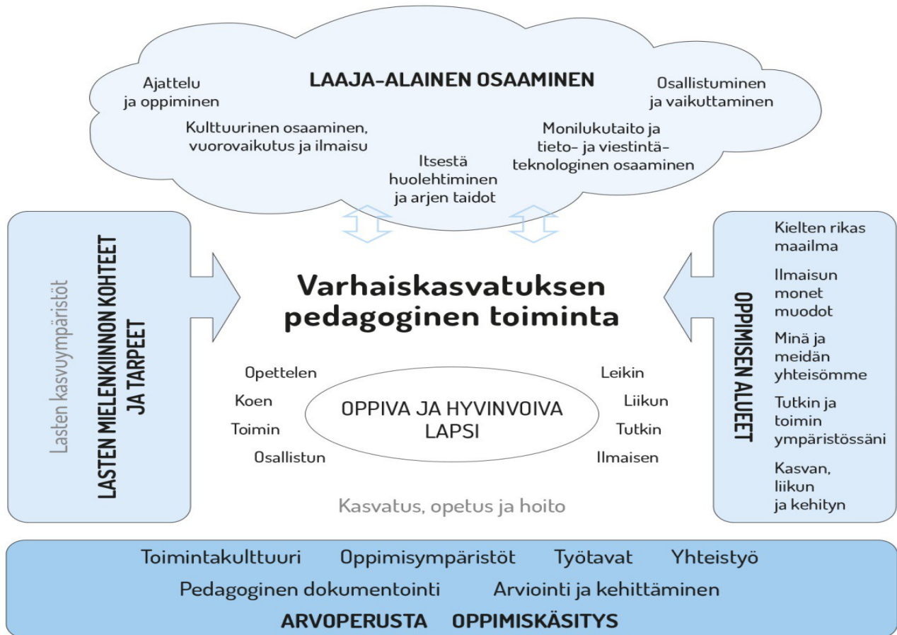
kuvio 1. Varhaiskasvatuksen pedagogisen toiminnan viitekehys

Tavoitteellisen toiminnan perustan luovat arvoperusta (luku 2.4), oppimiskäsitys (luku 2.5), niihin pohjautuva toimintakulttuuri (luku 3) sekä monipuoliset oppimisympäristöt (luku 3.2), yhteistyö (luku 3.3) ja työtavat (luku 4.3). Lasten mielenkiinnon kohteet ja tarpeet sekä heidän kasvu ympäristöönsä liittyvät merkitykselliset asiat ovat toiminnan suunnittelun lähtökohtana. Lähtökohtana ovat myös luvussa 4.5 kuvatut oppimisen alueet. Laadukkaan pedagogisen toiminnan edellytyksenä on suunnitelmallinen dokumentointi, arviointi ja kehittäminen (luvut 4.2 ja 7). Laaja-alaisen osaamisen tavoitteet ohjaavat osaltaan toiminnan suunnittelua (luku 2.7). Pedagogisen toiminnan tavoitteita ja periaatteita rakennetaan paikallisissa varhaiskasvatussuunnitelmissa. Tavoitteita tarkennettaessa on otettava huomioon varhaiskasvatuksen eri toimintamuodot, niiden henkilöstörakenne ja muut ominaispiirteet. Paikallinen varhaiskasvatussuunnitelma sekä lasten varhaiskasvatussuunnitelmat (luku 1.3) ovat lapsiryhmän toiminnan suunnittelun lähtökohtia. Toimintaa toteutetaan niin, että jokaisella lapsella on oikeus edetä oppimisessaan siten, että varhaiskasvatuksesta ja esiopetuksesta muodostuu lapselle mielekäs jatkumo.